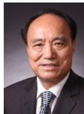
Houlin Zhao glavni tajnik ITU-a